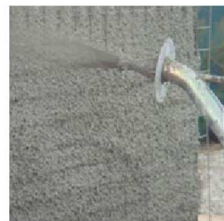
现场搅拌砂浆喷涂